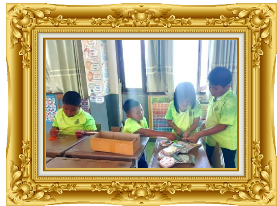
ภาพที่ ๔ การวิเคราะห์ผู้เรียนรายบุคคล

ขั้นตอนที่ ๓ (C : Check) : ประเมิน โดยจัดให้มีการประเมินตามสภาพจริง (Authentic Assessment) วิเคราะห์ปัญหาสาเหตุจากการเปรียบเทียบเป้าหมายกับการดำเนินตามแผน เพื่อให้ ทราบว่า ต้องปรับปรุงแก้ไข ร่วมกันตรวจสอบว่าวัสดุ อุปกรณ์มีความพร้อมสมบูรณ์ เพียงพอต่อการทำกิจกรรมมาก น้อยเพียงใด การเลือกกระดาษสา การเลือกริบบิ้น การตัด การพับ การประกอบ และการตกแต่งให้มีความ เรียบร้อย สวยงาม