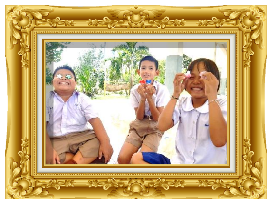
ภาพที่ ๒ ผลงานของนักเรียน