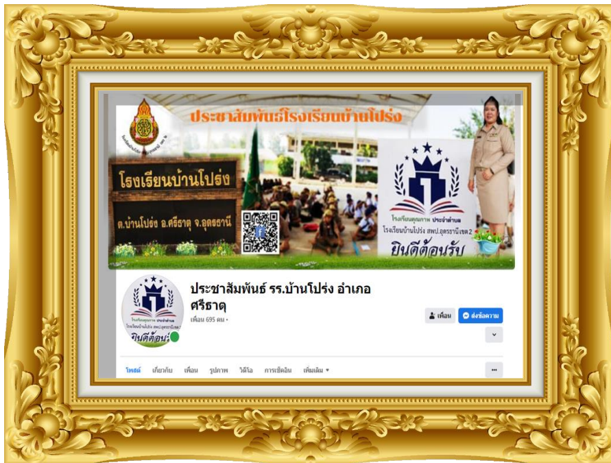
ภาพที่ ๗ Facebook ประชาสัมพันธ์ รร.บ้านโป่ง อำเภอศรีธาตุ

เผยแพร่ใน Facebook ประชาสัมพันธ์ รร.บ้านโป่ง อำเภอศรีธาตุ