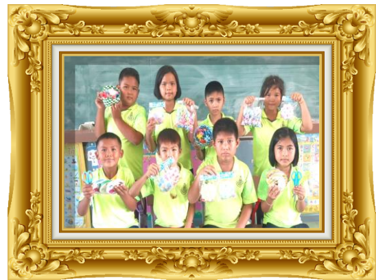
ภาพที่ ๖ การวิเคราะห์ปัญหาและสาเหตุมาปรับปรุงแก้ไข