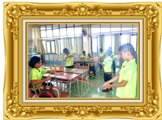
ภาพที่ ๕ การประเมินตามสภาพจริง

ขั้นตอนที่ ๔ (A : Act) : ปรับปรุงแก้ไข ได้แก่ การนำผลการวิเคราะห์ปัญหาและสาเหตุมาปรับปรุงแก้ไขเพื่อให้เกิดการพัฒนา วนไปเรื่อย ๆ ตามวงจรคุณภาพ PDCA นักเรียนร่วมกันตัดสินใจเลือกแบบที่ชัดเจน พัฒนาฝีมือการทำหลายครั้ง จนเกิดทักษะที่ชำนาญและคงถาวร